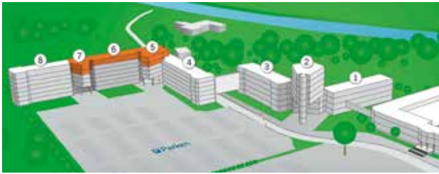
Haupteingang Gebäude 5, Tagungsort: 6. Stock, Raum „Wien“