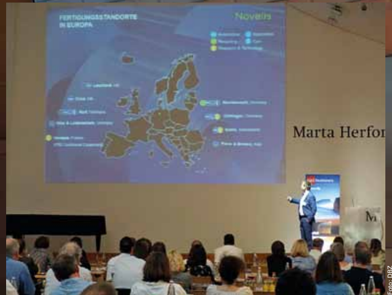
Die Fachvorträge laden die Gäste zum anschließenden Austausch ...